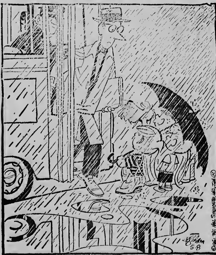
„Wij zijn je komen athalen met de paraplu...!“